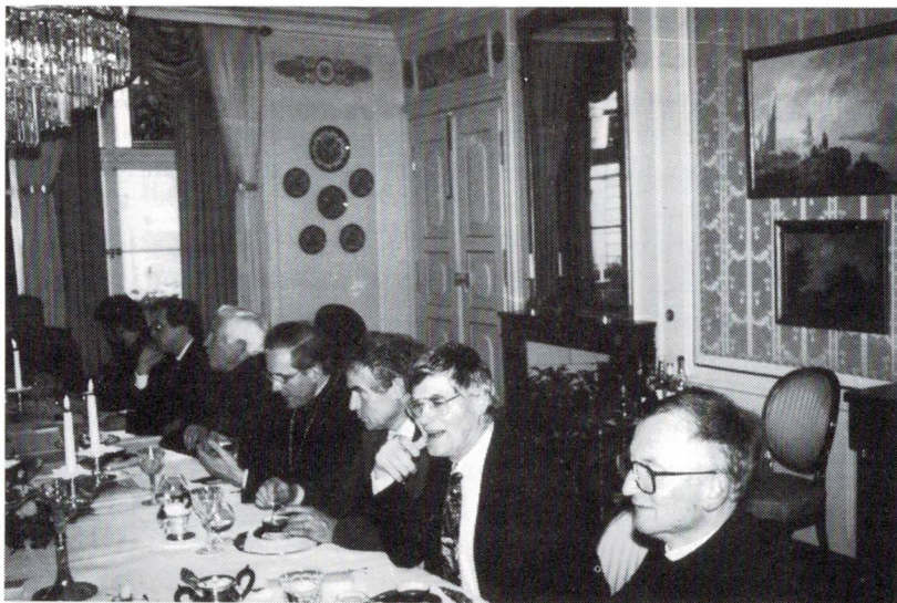
Festliche Tafel in stilvoller Umgebung

chen: sozusagen ein Spiegelbild unserer menschlichen Natur. Aus den Widersprüchen erhebt sich eine faszinierende, würdige Geschichte eines kleinen Volkes, welches durch tausend Stürme hindurch sich über Jahrhunderte halten konnte. Eine Geschichte, die unsere Pflege und Zuneigung verdient.» (Aus: Stunde der Wahrheit für die Schweiz. Erich Gysling im Gespräch mit Flavio Cotti. Universitätsverlag Freiburg, S. 45)